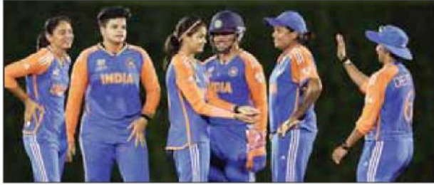
ऑस्ट्रेलिया सबसे बड़ी चुनौती

भारत, इंग्लैंड और दक्षिण अफ्रीका जैसी टीमों में गुरुवार से शुरू होने वाले महिला टी20 विश्व कप में ऑस्ट्रेलिया का पिछले लंबे समय से चला आ रहा वर्चस्व खत्म करने की कोशिश करेंगी। टूर्नामेंट की शुरुआत गुरुवार को शारजाह में होने वाले दो मैचों से होगी। इनमें पहला मैच बांग्लादेश और स्कॉटलैंड तथा दूसरा मैच पाकिस्तान और श्रीलंका के बीच खेला जाएगा। पहले इस टूर्नामेंट का आयोजन बांग्लादेश में होना था लेकिन वहां राजनीतिक अशांति के कारण अंतरराष्ट्रीय क्रिकेट परिषद ने इसे संयुक्त अरब अमीरात में स्थानांतरित कर दिया था। प्रत्येक ग्रुप से शीर्ष पर रहने वाली दो टीमों से मीफाइनल में जगह बनावेगी।