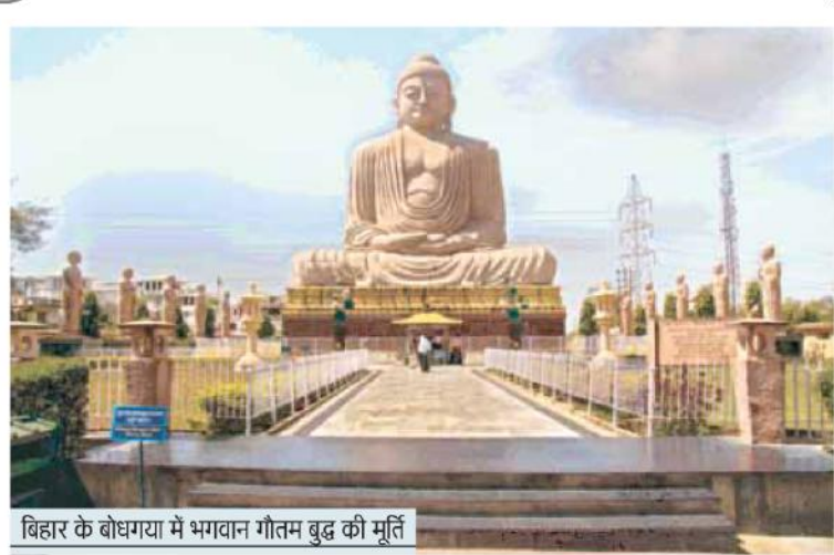
बिहार के बोधगया में भगवान गौतम बुद्ध की मूर्ति

एजेंसी नई दिल्ली बौद्ध देशों के पर्यटकों को अपने देश के भीतर स्वयं की मातृ भाषा में भारतीय बौद्ध सर्किट के तीर्थ स्थलों को जान समझ सकेगें। अब तक पर्यटकों की भाषा में ही बौद्ध तीर्थस्थलों के संबंध में जानकारी पाते थे। केंद्र और राज्य का पर्यटन विभाग बौद्ध देशों में सक्रिय हो गया है। सरकार की इस योजना से बौद्ध सर्किट में विदेशी पर्यटकों की संख्या बढ़ने की उम्मीद है।