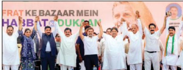
हरिगुमि ब्यूरो नई दिल्ली

जम्मू कश्मीर को केंद्रशासित बनाकर संपूर्ण राज्य का हक छीना, कांग्रेस बहाल करेगी