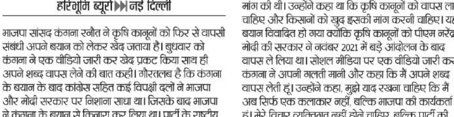
हरिगुमि ब्यूरो नई दिल्ली

माजपा ने कंगना के बयान से खुद को किया अलग