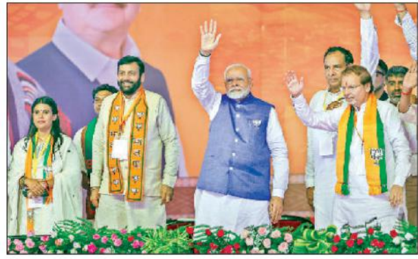
किसानों को बेहतर मिलेंगे दाम

पीएम मोदी ने कहा कि हमने भारत के तिलहन किसानों के लिए भी बड़ा फैसला किया है, विदेश से आयात होने वाले तेल पर हमने टैक्स बढ़ा दिया है। कोशिश यही है कि भारत के तिलहन किसानों को ज्यादा से ज्यादा खरीद ही। अब जैसे सूरजमुखी के आयात के पर पहले टैक्स नहीं था, अब बीस प्रतिशत टैक्स लगाया है। इससे हरियाणा के ऐसे किसानों को बेहतर दाम मिलेंगे। कांग्रेस आई तो हरियाणा को बर्बाद कर देगी मोदी ने कहा कि अगर कांग्रेस की सरकार आई तो हरियाणा को बर्बाद कर देगी। कांग्रेस में सिर-फुटीवेल मचा हुआ है। कर्नाटक में इनके सीएम और डिप्टी सीएम लड़ रहे हैं। यही हाल हिमाचल और तेलंगाना में है। यहां कांग्रेस को लाने का मतलब हरियाणा के विकास को दब पर लगाना है।