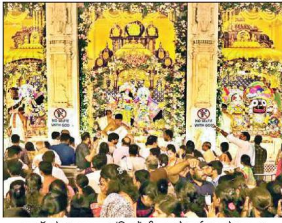
इस्कोन के अहमदाबाद मंदिर में श्रीकृष्ण के दर्शन करते श्रद्धालु।

श्रीकृष्ण जन्माष्टमी के अवसर पर सोमवार को भगवान कृष्ण का जन्मदिन पूरे धूमधाम से मनाया गया। देश भर के विभिन्न मंदिरों में भक्तों की भीड़ उमड़ पड़ी। सोमवार को राधा कृष्ण परिसर के सभी मंदिरों में घंटियां, मुद्ग और शंख की ध्वनि गूंज उठी। भगवान कृष्ण की जन्मस्थली मथुरा मंदिर भी कृष्ण भक्तों से भरे रहे। द्वारका में भी भगवान के भक्त पूजा-पाठ के लिए पहुंचे। देशभर के इस्कोन मंदिर में भगवान कृष्ण के दर्शन के लिए बड़ी संख्या में भक्त उमड़े। इस्कोन मंदिरों में महोत्सव में 27 को जन्माष्टमी किया आज नंदोत्सव का आयोजन होगा।