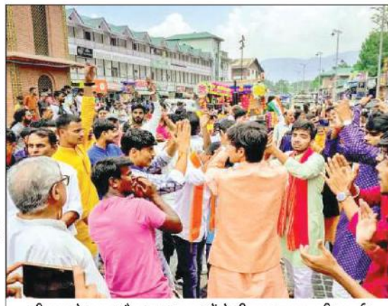
श्रीनगर के लाल चौक पर श्रद्धालुओं ने श्रीकृष्ण जन्माष्टमी मनाई।