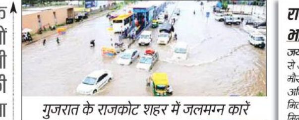
गुजरात के राजकोट शहर में जलमग्न कारें

देश के कई भागों में बिजली गिरने की संभावना भारतीय मौसम विभाग (आईएमडी) के मुताबिक आज गुजरात के कुछ स्थानों पर बेहद भारी बारिश (20 सेमी से ज्यादा) की संभावना है। केरल, तेलंगाना में बिजली गिरने के साथ तूफान आने की संभावना है। राजस्थान, गोवा, मध्य महाराष्ट्र के कुछ स्थानों पर भारी बारिश (12 सेमी) की संभावना है। जम्मू-कश्मीर, लद्दाख, गिलगित, बाल्टिस्तान मुजफ्फराबाद, हिमाचल प्रदेश, उत्तराखंड, पंजाब, हरियाणा-चंडीगढ़, अंडमान और निकोबार द्वीप समूह, बिहार, झारखंड, असम, मेघालय, नगालैंड, मणिपुर, मिजोरम और त्रिपुरा, केरल, तटीय कर्नाटक के कुछ स्थानों पर 7 सेमी तक बारिश होने की संभावना है। वहीं, जम्मू-कश्मीर, लद्दाख, गिलगित, बाल्टिस्तान मुजफ्फराबाद, हिमाचल प्रदेश, उत्तराखंड, मध्य प्रदेश, छत्तीसगढ़, असम, मेघालय के कुछ हिस्सों में बिजली गिरने की संभावना है।