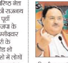
भाजपा अध्यक्ष जेपीनहुवा कर्नाटक के शिमोगा में एक बौद्धिक बैठक में शामिल हुए। नहुवा ने कहा कि राज्य में सीएम सिद्धार्थमैया के नेतृत्व वाली कांग्रेस सरकार ने मुसलमानों को ओबीसी कोटा से 4 फीसद आरक्षण दिया था। उन्होंने मुस्लिमों के लिए आरक्षण पर टिप्पणी करते हुए कहा कि बी.आर. आंबेडकर ने कहा कि धार्मिक आधार पर आरक्षण के लिए कोई जगह नहीं है। हम मुस्लिम समुदाय के खिलाफ नहीं हैं, लेकिन हमें यह समझना होगा कि संविधान स्पष्ट रूप से कहता है कि धर्म के आधार पर कोई आरक्षण नहीं होगा, लेकिन कांग्रेस धूर्त और दिमाजनाकरी मंस्खे रखती है।