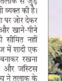
अदालत ने शादी को लेकर कहा कि केवल रजिस्ट्रेशन करा लेना ही विवाह को वैधता नहीं देता है। कई ऐसे उदाहरण हैं जो कानून के आधार पर रजिस्ट्रेशन करा लेते हैं। रजिस्ट्रार द्वारा ऐसा कोई सर्टिफिकेट जारी नहीं किया जाता।