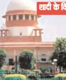
जब अदालत ने मामले की सुनवाई शुरू की तो सॉलिसिटर जनरल तुषार मेहता ने बेंच से माफ़ी मांगते हुए इसे 2 बजे शुरू करने की मांग की और कहा कि एक अन्य संवैधानिक पीठ में उन्हें जाना है। जस्टिस गवई ने कहा, जो लोग आलोचना करते हैं, वे नहीं जानते कि हमारी शनिवार-रविवार को भी छुट्टियां नहीं होती हैं। यहां तक कि त्योहारों में भी छुट्टी नहीं होती।