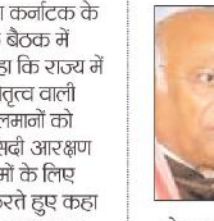
इटवा। लोकसभा चुनाव के लिए एक दूसरे पर शब्द बाण चला रहे नेता कभी कभी कुछ ऐसा बोल जाते हैं। इटवा के जसवंतनगर विधानसभा क्षेत्र में सपा के राष्ट्रीय महासचिव शिवपाल सिंह यादव ने कर दिया है। डिंपल यादव के समर्थन में जनसभा की संबोधित करते हुए यादव ने सपा की जगह भाजपा को जिताने की अपील कर दी। अखिलेश यादव समेत यहां मौजूद हर कोई चौंक गए। शिवपाल को बाद में मलती का अहसास हुआ।