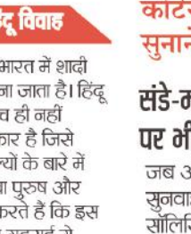
जब अदालत ने मामले की सुनवाई शुरू की तो सॉलिसिटर जनरल तुषार मेहता ने बेंच से माफ़ी मांगते हुए इसे 2 बजे शुरू करने की मांग की और कहा कि एक अन्य संवैधानिक पीठ में उन्हें जाना है। जस्टिस गवई ने कहा, जो लोग आलोचना करते हैं, वे नहीं जानते कि हमारी शनिवार-रविवार को भी छुट्टियां नहीं होती हैं। यहां तक कि त्योहारों में भी छुट्टी नहीं होती।