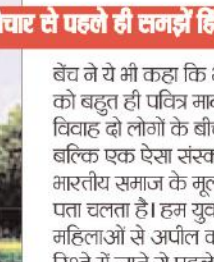
बेंच ने ये भी कहा कि भारत में शादी को बहुत ही पवित्र माना जाता है। हिंदू विवाह दो लोगों के बीच ही नहीं बल्कि एक ऐसा संस्कार है जिसे भारतीय समाज के मूल्यों के बारे में पता चलता है। हम युवा पुरुष और महिलाओं से अपील करते हैं कि इस रिश्ते में जाने से पहले गहराई से भारतीय समाज के इस संस्था की पवित्रता पर विचार करें।