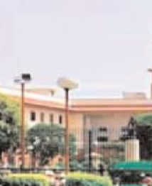
कोर्ट ने कहा कि हिंदू नैरिज एक्ट की धारा 8 के तहत आज के समय में लोग शादी रजिस्ट्रार कराना चाहते हैं। इस एक्ट के तहत सिर्फ रजिस्ट्रेशन करा लेना ही शादी को वैध नहीं बनाया है। जोड़ा माता-पिता विदेश में रहने के दौरान चीना आवेदन के लिए शादी के रजिस्ट्रेशन को लेकर तैयार हो जाते हैं।