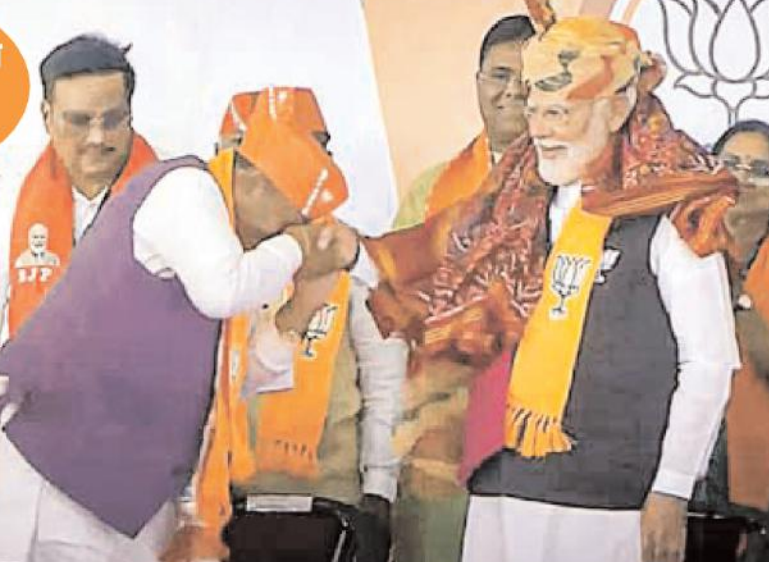
गुजरात तिवस : विकास की नई ऊंचाइयों को छूता रहे गुजरात

फेक वीडियो को लेकर उन्होंने कहा कि पहले चरण में इंडी गठबंधन पस्त हुआ और दूसरे चरण में ध्वस्त हो गया। ये लोग मुहब्बत की दुकान चलाने निकले थे। लेकिन दुकान में फेक वीडियो बनाने का काम शुरू कर दिया। इन लोगों ने इतने साल देश पर राज किया। इनके इतने सारे पीएम रहे। फिर भी आज इनकी लोगों को सामने जाने की हिम्मत नहीं है। अब ये फेक वीडियो बना रहे हैं।