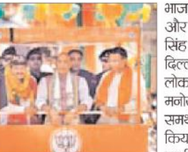
भाजपा के वरिष्ठ नेता और रक्षा मंत्री राजनाथ सिंह ने उत्तर पूर्वी दिल्ली से भाजपा के लोकसभा उम्मीदवार मनोज तिवारी के समर्थन में रोड शो किया। रोड शो में लोगों का विशाल जुलूम था।